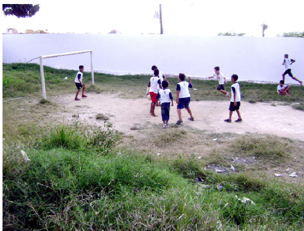
Imagem 05: Minicampo da Escola Tiradentes: futebol, mato e desníveis

Compreendemos que a escola precisa sofrer uma intervenção do poder público que a administra, em relação à quantidade e qualidade dos espaços e equipamentos destinados ao seu cotidiano lúdico. Até mesmo porque, sabemos que, muitas vezes, a população, especialmente as crianças, não avalia os riscos da utilização de certos locais inapropriados para o uso, o que pode comprometer sua segurança e sua saúde.